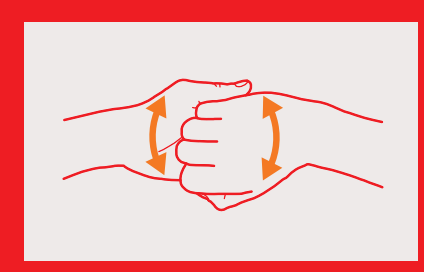
4. Aussenseite der Finger auf gegenseitiger Handfläche mit verschränkten Fingern