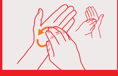
6. kreisendes Reiben hin und her mit geschlossenen Fingerkuppen in der Hohlhand für beide Hände