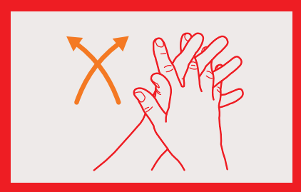
3. Handfläche auf Handfläche mit verschränkten, gespreizten Fingern